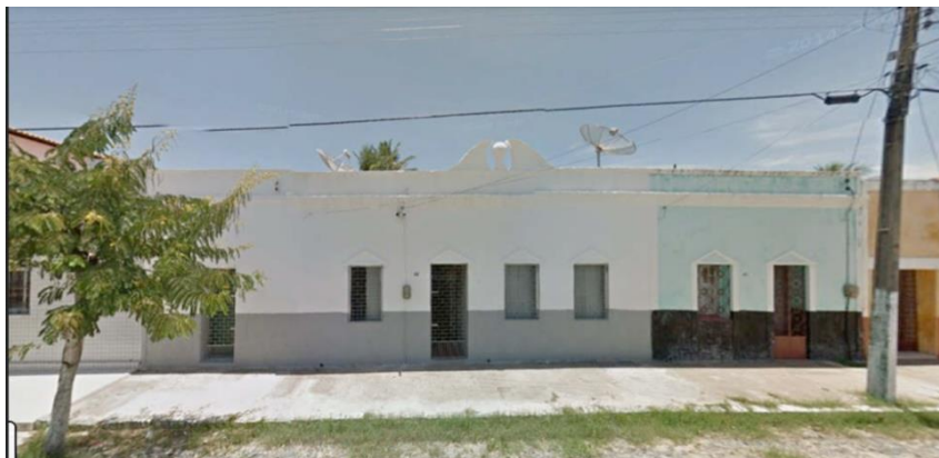
Fachada original do imóvel

O imóvel centenário possui uma história que atesta sua unidade física e dominial , essencial para entender a irregularidade registral: